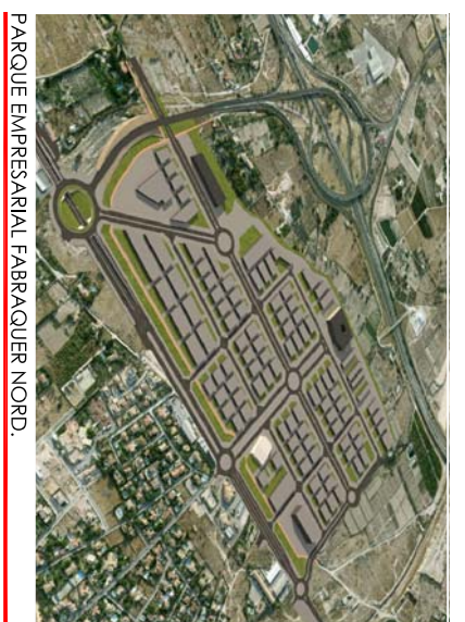
PARQUE EMPRESARIAL FABRAQUER NORD.