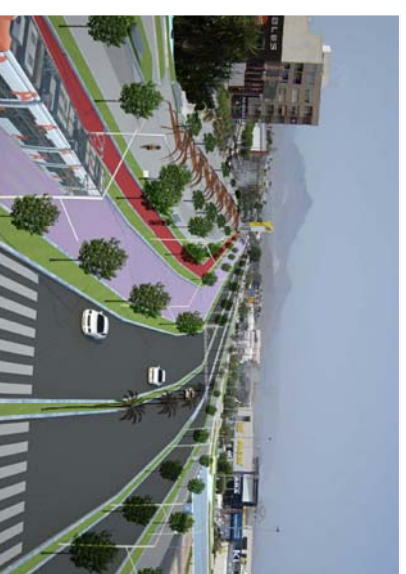
TRANSFORMACIÓN DE LA TRAVESÍA DE LA N-332 EN LA AVENIDA MIGUEL HERNÁNDEZ