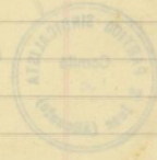
Constitució de l'Agrupació Local del Partit Sindicalista (AMSJA 1-C-1209-9)