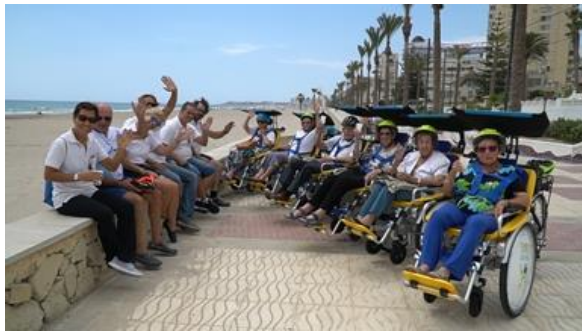
Residencia 3ª edad Anneke – Alicante - 2019

Niños, jóvenes y adultos, incluso personas de tercera edad, disfrutan en familia, con amigos o voluntarios, del deporte adaptado al aire libre . Mejoran su calidad de vida gracias a sus ventajas terapéuticas y beneficios en el área cognitiva y motora .