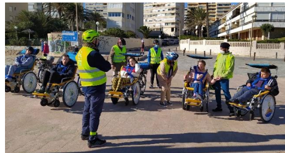
San Juan de Alicante 2021