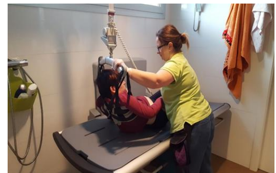
Los baños cuentan con camillas para cambios y duchas