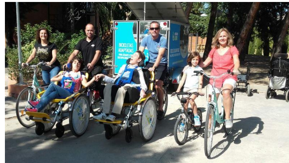
Albergue Sta. María de la Paz – Orden San Juan de Dios- Madrid 2019