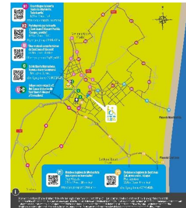
Plano de rutas