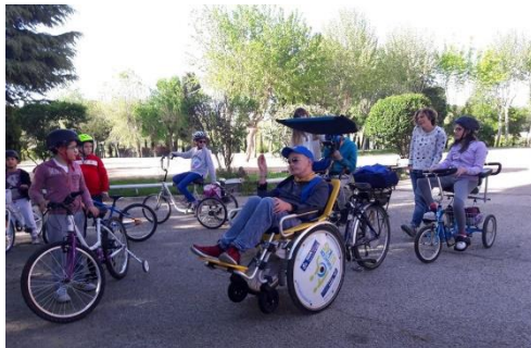
Asociación Infantil Oncológica de Madrid – ASION - 2019