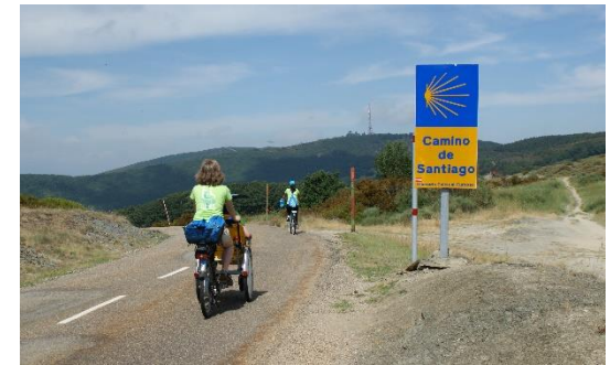
Camino de Santiago 2017 - AM Solidarios Non Stop