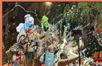
Carroza ganadora 2023 PREMIO ESPECIAL