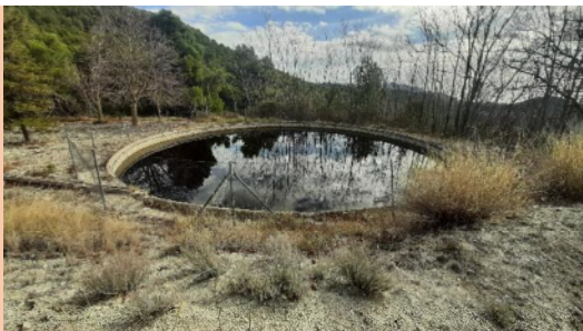
Bassa de Bugaia. Foto de l'autor, gener 2024.

Aquí viene lo importante; aquí viene lo jugoso.