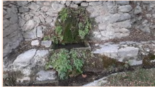
Font de Bugaia. Foto de l'autor, gener 2024.

El tío Pepe, dice: repite lo de siempre. "Esta agua que ustedes ven que corre por aquí no es más que una insignificante cantidad de la mucha que corre por allá, -y señala la fuente-. Por allí pasa un río que va a