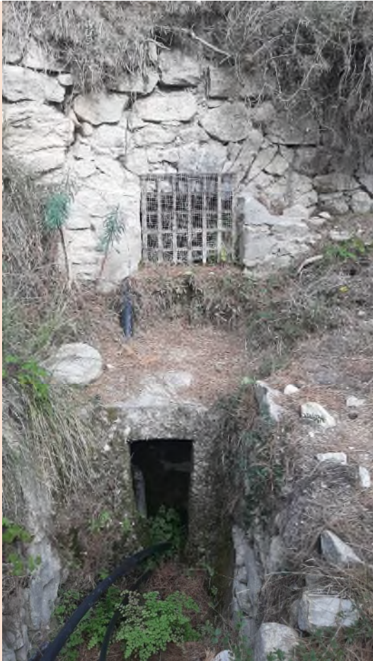
Alcavor o alcavó: mina d'aigua o pas subterrani d'una séquia. Foto de l'autor, gener 2024.

perderse, y se asegura que va a parar a Altea y el agua ésta, la que corre por aquí es la que se desborda de las márgenes de ese gran río subterráneo que yo he visto con mis ojos. Porque jóiganlo ustedes bien! Cuando se hizo el minado se fue subiendo en escalones y se han dejado bajo al río". Esto lo confirman otros muchos prácticos del terreno.