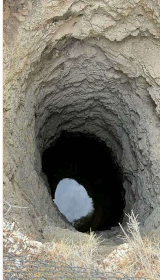
Pou artesià en la partida de Bugaia. Foto de l'autor, gener 2024