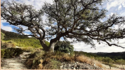
Potser es tracte d'aquesta carrasca. gener 2024.

Llegamos al replano. Carbonell se sienta al lado de una fuente que mana. Un árbol milenario, cuyo tronco está tutelado, le da sombra al caño y al caminante.